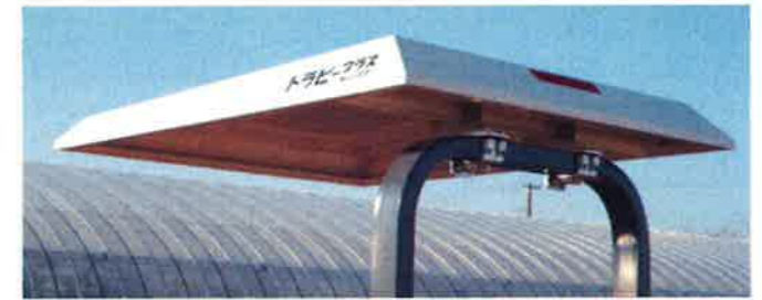
取り付け完成写真