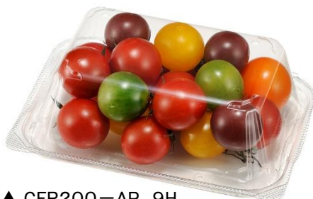
▲ CFR200-AP. 9H [カラフルミニトマト]