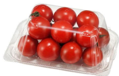
▲ CFR100-AP. 9H [ミニトマト]